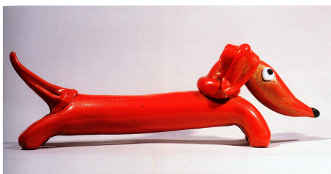
Venini, design Napoleone Martinuzzi, 1930